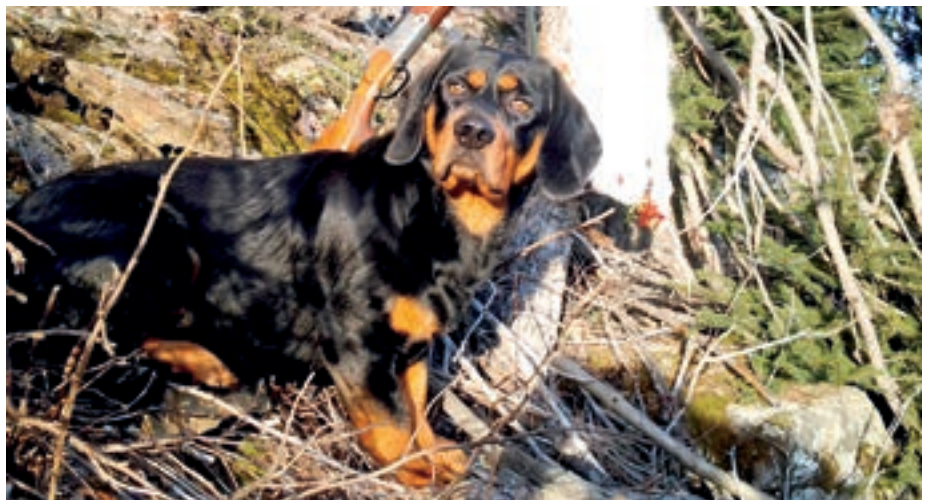
Dachsbracken sind niederläufige, kräftige Jagdhunde mit robustem, starkknochigem Körperbau, dichtem Haarkleid und fester Muskulatur.

Unser Bestreben geht dahin, den Stellenwert der Dachsbracke als Schweißhund weiter zu erhöhen. Da ein guter Spurlaut bei der Dachsbracke unverzichtbar ist, ist es ebenso unser Wunsch, dass die äußerst reizvolle laute Jagd auf Hase und Fuchs wieder mehr ausgeübt werde.