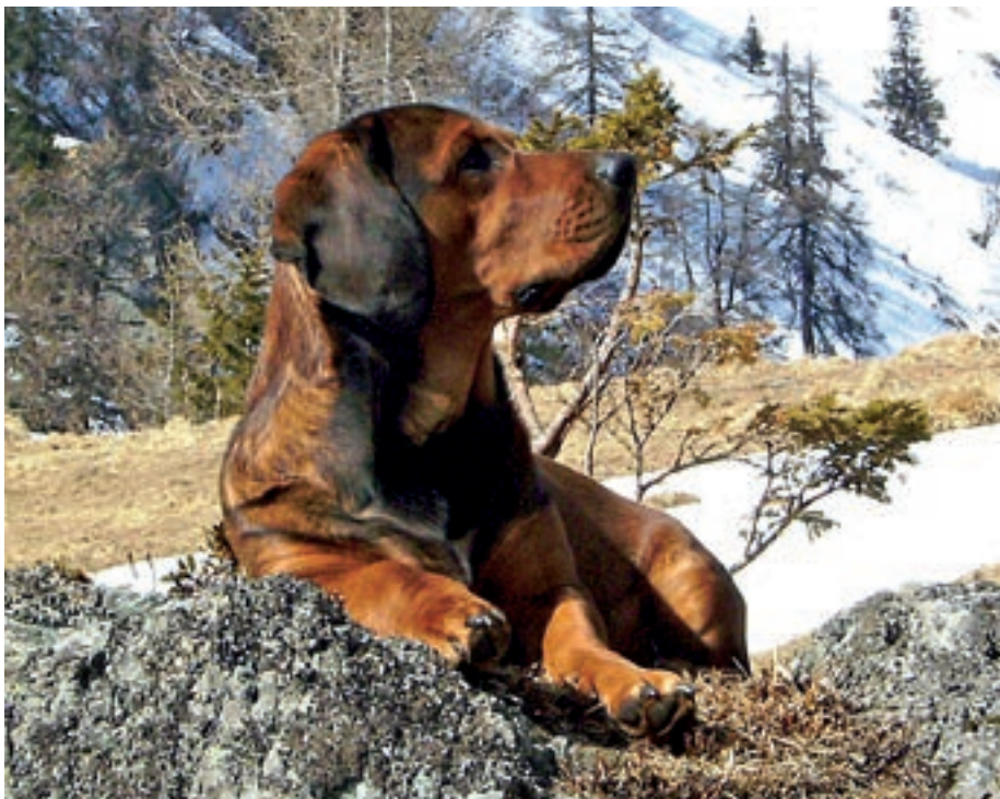
Die beiden bei der Dachsbracke vorkommenden Farbschläge: hirschrot (oben) und schwarz mit braunem Brand (unten)