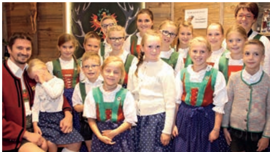
Die Kindergruppe des Trachtenvereins „Die Naviser“ schupplattelten am Samstag