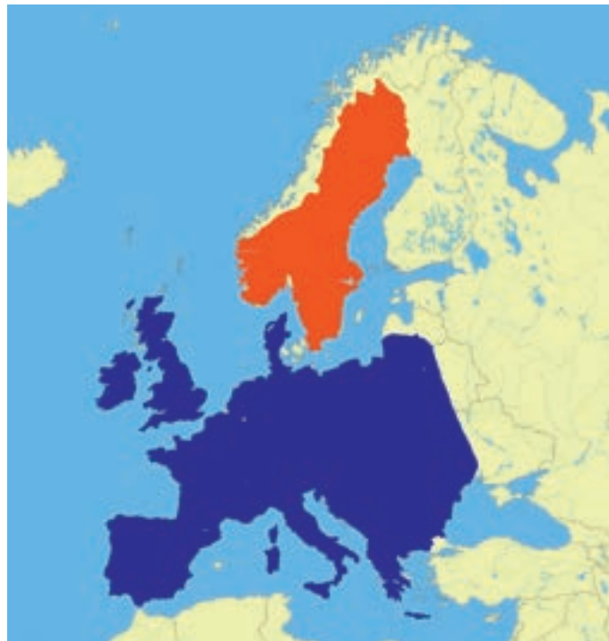
Verbreitung des Mäusebussards: Orange – Brutgebiete, die im Winter geräumt werden; Blau – Brutgebiete, die ganzjährig genutzt werden.

Vom Mäusebussard sind derzeit weltweit insgesamt elf geographische Unterarten anerkannt. Sieben davon sind in der Westpaläarktis beheimatet.