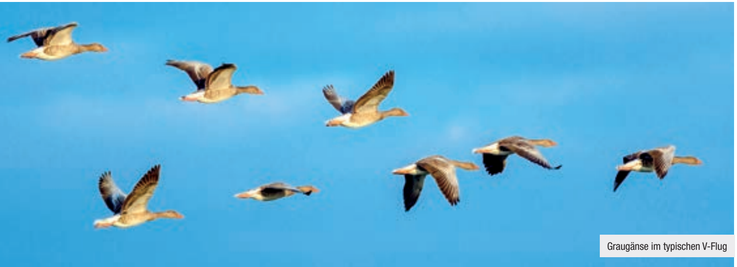
Graugänse im typischen V-Flug