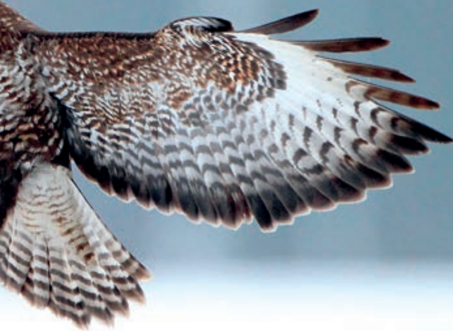
Mäusebussard im Anflug

ist generell ein Zugvogel, der aufgrund von Nahrungsknappheit in den Wintermonaten in südlichere Länder zieht. Den Herbstzug, der im Oktober seinen Höhepunkt erreicht, kann man schon ab Ende August beobachten. Mit dem Frühjahrszug im Februar/März geht es dann wieder zurück in die Heimat. Außerhalb der Fortpflanzungszeit sind Mäusebussarde recht gesellig und wenn ausreichend Nahrungsangebot besteht, oft auch zu mehreren auf Wiesen und Feldern anzutreffen. Im Winter aber kann es aufgrund von Nahrungsmangel durchaus