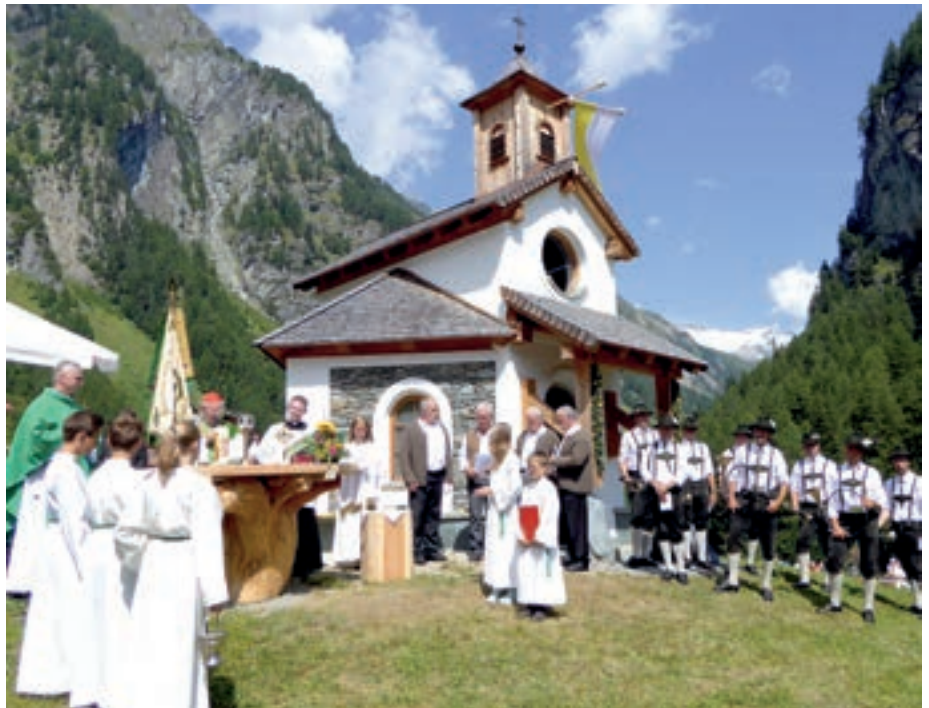
Die Hubertuskapelle Hinterbichl wurde feierlich eingeweiht.