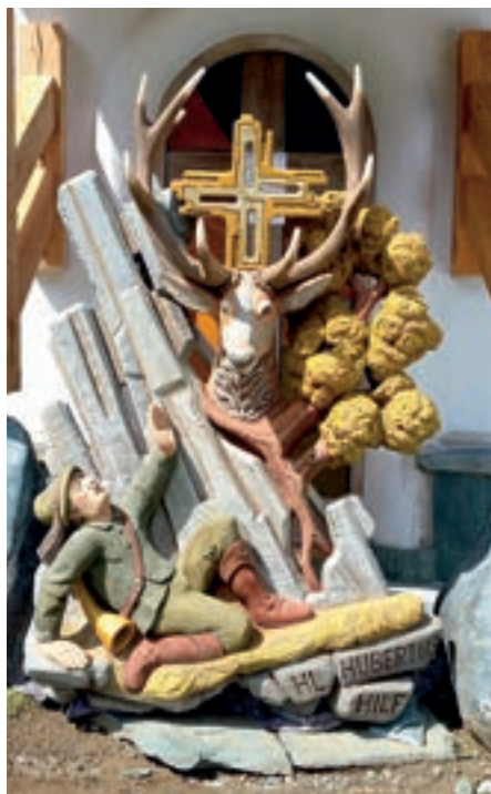
Das Abbild vom Hl. Hubertus wurde von Alois Weiskopf gestaltet.