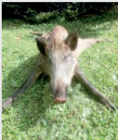
Im Gaistal in der Leutasch konnte dieser 2-jährige Keiler erlegt werden. Weidmannsheil dem Erleger!