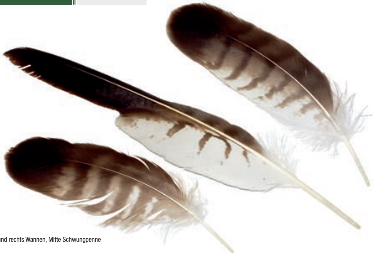
Links und rechts Wannen, Mitte Schwungpenne

wobei die äußerste Binde sich dunkel und breiter als die anderen zeigt. Ein deutliches Merkmal für den Mäusebussard ist die helle Flügelunterseite, die ebenfalls leichte Binden zeigt. Die Flügelkanten und die Finger sind beim Mäusebussard immer dunkel bis schwarz.