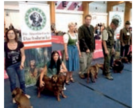
Neun Dachshbracken traten bei der IHA in Innsbruck an.