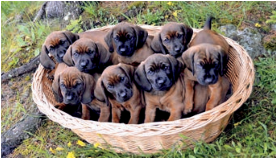
Bereits im Welpenalter sollte auf eine artgerechte Fütterung geachtet werden.

Unbedingt notwendig – besonders an warmen Jagdtagen – ist jedoch eine ausreichende Wasserversorgung vor, während und nach der Jagd. Ein Wassermangel senkt nicht nur die Leistungsbereitschaft, sondern ist auch belastend für den Kreislauf.