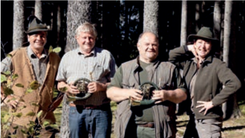
Am Sonntag wird an unterschiedlichen Stationen in den Revieren über das richtige Verhalten in der freien Natur aufgeklärt.

in Aktionswochenende: Samstag, 17. Oktober, 10.00 Uhr bis 17.00 Uhr, Marktplatz und Sonntag, 18. Oktober, 11.00 Uhr bis 15.00 Uhr in den Revieren