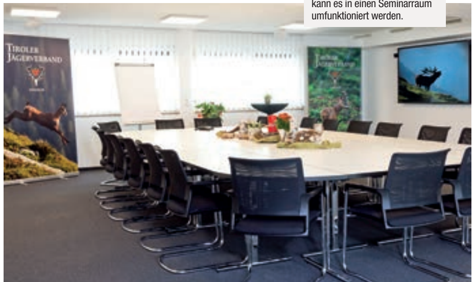
Das Sitzungszimmer: Bei Bedarf kann es in einen Seminarraum umfunktioniert werden.