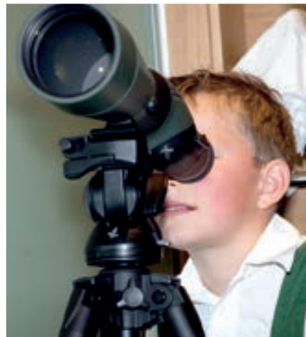
Für die Kleinen gab es ein tolles Kinderprogramm.