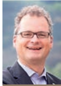
Univ. Prof. Dr. Klaus Hackländer

E in Blick auf die Situation der Jagd in Österreich und im benachbarten Ausland zeigt, dass große Herausforderungen für Jägerinnen und Jäger anstehen: Landesbehörden verwechseln in ihren Entwürfen zu Jagdgesetznovellen manchmal einschneidende Einschränkungen der Jagd mit Artenschutz, Grundbesitzer und Behörden suchen den Schuldigen für steigende Wildschäden oft alleine beim Jagdausübungsberechtigten, die urbane Gesellschaft entfernt sich immer mehr vom natürlichen Umgang mit unserer Natur usw. Wie soll man all dem begegnen?