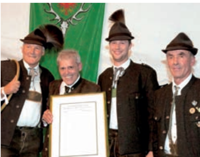
Die Hubertusbläser Tirol übergaben dem LJM zum Anlass der Eröffnung die Original-Partitur der eigens komponierten Hubertusfanfare