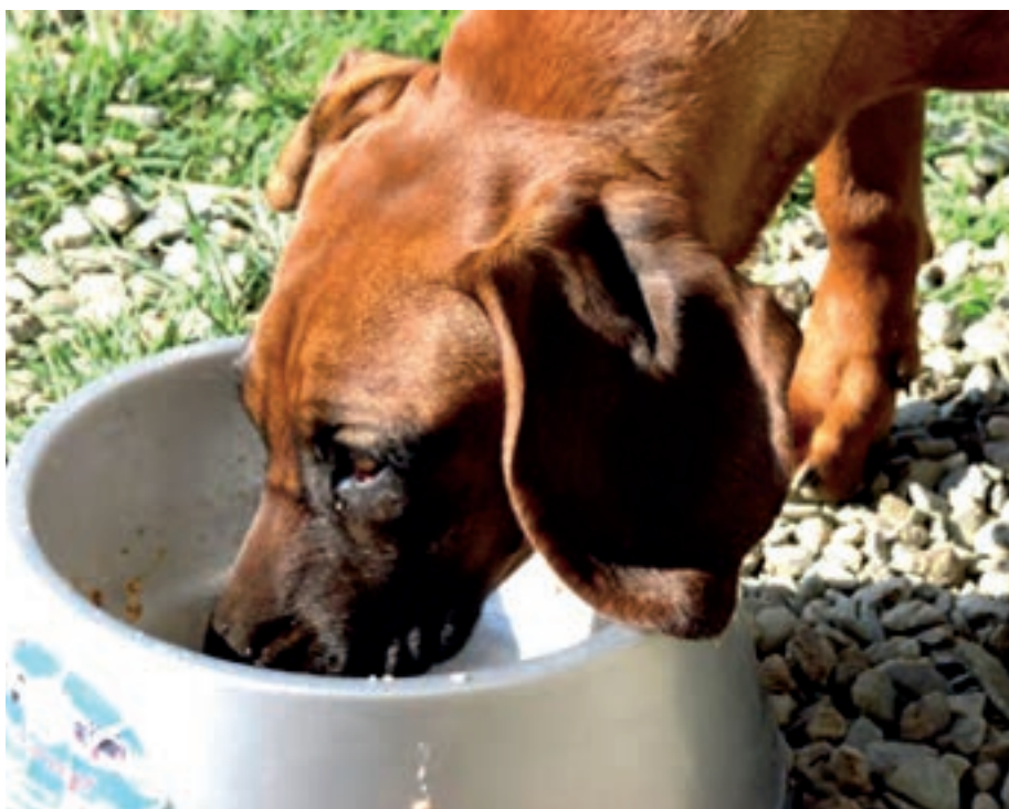
Bei der Hundefütterung können unbewusst große Fehler passieren.

definiert ist (Geflügelfleisch beispielsweise ist ein hochwertiger Eiweißträger). Die Kotmenge eines Hundes kann Aufschluss darüber geben, wie gut er sein Futter verwertet. Eine große Kotmenge deutet oft auf ein minderwertiges Futter hin. Hat Ihr Hund ein glänzendes Fell, ein bis zweimal täglich wenig und festen Stuhlgang und ist er vital, so ist das ein Zeichen für ein passendes Futter. Futterwechsel sollten nicht zu oft vorgenommen werden, da unterschiedliches Futter den Verdauungstrakt irritiert (Viel Abwechslung beim Essen ist ein menschliches Bedürfnis!). Bezüglich der Futtermenge sollten Sie sich an die Empfehlungen der Hersteller halten. Bei extrem wenig oder viel Bewegung muss die Menge individuell angepasst werden. Junghunde sollen 4-mal täglich gefüttert werden, erwachsene Hunde brauchen nur eine Mahlzeit pro Tag. Allerdings kann die Tagesration ohne weiteres auch auf zwei bis drei Mahlzeiten aufgeteilt werden. Dies empfiehlt sich bei laktierenden Hündinnen oder bei großen Hunderassen, die zur Magendrehung neigen. Futterzusätze sollten nur in Absprache mit dem Tierarzt gegeben werden.