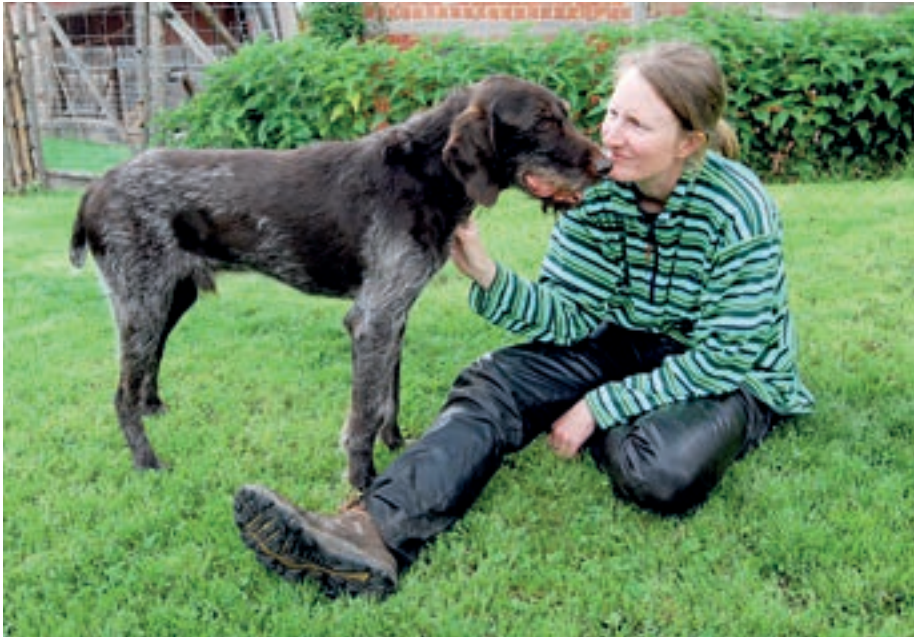
Massierende Berührungen können als Signal für die konditionierte Entspannung eingesetzt werden.

Erregung meines Hundes etwas modulieren – zum Abschaltknopf für aufgeregte Hunde wird sie natürlich nicht. Es ist nur eine von mehreren Möglichkeiten, Einfluss darauf zu nehmen, dass Silas ansprechbar wird oder bleibt. Er behält damit Zugriff auf sein Großhirn, welches beim Lernen oder zum Abrufen von Lerninhalten gebraucht wird. Die meisten von uns haben es an sich selbst schon erlebt: Man ist vor Aufregung wie vernagelt, die einfachsten Dinge wollen einem plötzlich nicht mehr einfallen – und wer unter Prüfungsangst leidet, kann sich bildlich vorstellen, was in Silas vorgeht. Ähnliches passiert auch, wenn man vor lauter Vorfreude und Begeisterung ganz aus dem Häuschen