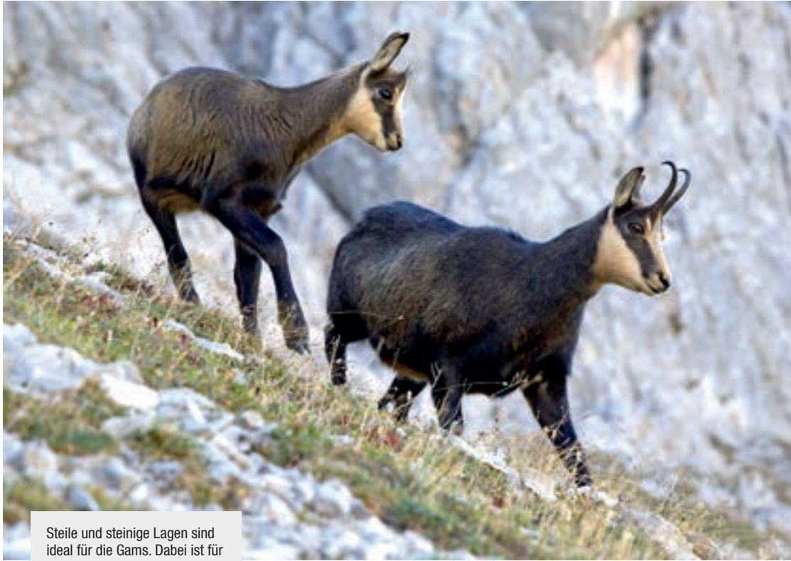
Steile und steinige Lagen sind ideal für die Gams. Dabei ist für die Einstandswahl der Gams der Waldanteil nicht entscheidend.