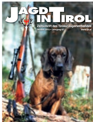
Das Titelbild dieser Ausgabe stammt von Martin Schwärzler