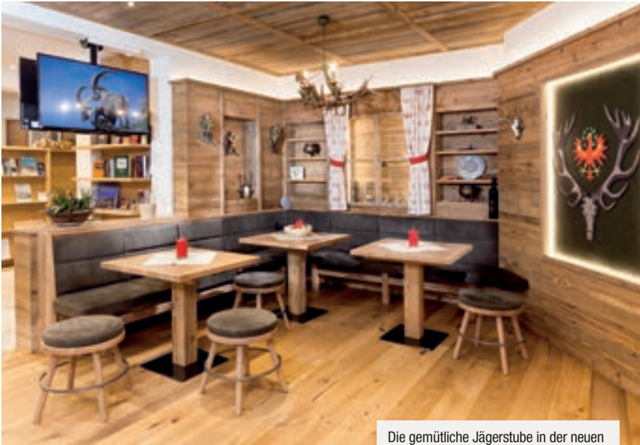
Die gemütliche Jägerstube in der neuen Geschäftsstelle lädt zum Verweilen ein.

uns auf einem sehr guten Weg befinden, auch wenn von mancher Seite oft unsachliche Argumente vorgebracht werden. Zum Beispiel: Am 17.09. wurde in der Innenstadt gegen Gatterjagden demonstriert. Das hat mich doch sehr überrascht. Man könnte ja fast meinen, die Organisatoren dieser Veranstaltung haben sich im Bundesland vergriffen. In Tirol gegen Gatter und die Jagd dort aufzurufen, ist so, als würde man in der Sahara gegen Eisbärenjagd demonstrieren. Bei uns in Tirol gibt es keine Jagdgatter, das ist gut so und wir brauchen niemanden der gegen etwas demonstriert, das bei uns nicht ausgeübt wird. Aber diese Demonstration zeigt uns auch, dass der gesellschaftliche Druck steigt und wir aktiv und offensiv Position beziehen müssen. Wir dürfen es nicht so weit kommen lassen, wie in Deutschland. Wir sind mitten in der Tiroler Gesellschaft verankert und lassen uns nicht an den Rand drängen. Aber ich muss auch zugeben: Ähnliche Vorfälle, wie in der Leutasch kann weder die Tiroler Jägerschaft noch ich brauchen!