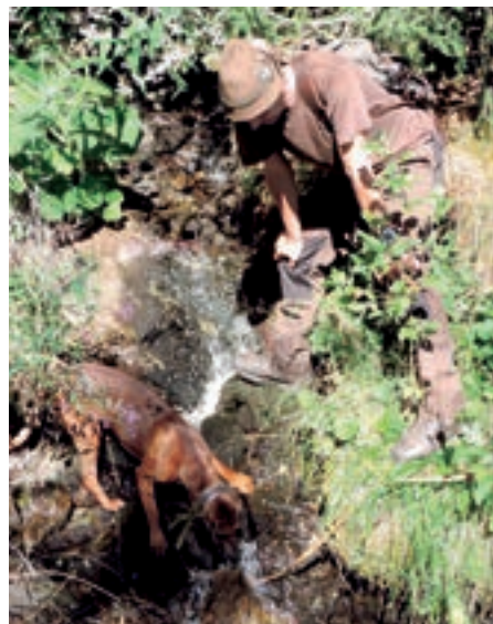
Die Trockenheit stellte für die Hunde die größte Herausforderung dar.

Am Vortag war ein grüner Abend mit Musik und Wildbretspezialitäten (Kaltenbacher Schihütte) organisiert. Der Erfahrungsaustausch mit dem Landesjägermeister, Vertretern des TJV, Ehrengästen und vor allem anderen Hundeführern motivierte zu voller Leistung am nachfolgenden Prüfungstag. Durch die hohen Temperaturen und Föhn während der Stehzeit der Fährten war die Aufgabe, die sich den Suchengespannen stellte, entsprechend schwierig. Anders als in Vorjahren stand heuer eine sehr anspruchsvolle Schweißprüfung ohne Richterbegleitung am Programm: Eine 1000 Meter lange Schweißfährte (1/4 Liter Schweiß) musste von Hund und Führer selbstständig (d. h. ohne Richterbegleitung) ausgearbeitet werden. Zur Hilfe der Hundeführer lagen auf der Schweißfährte lediglich fünf Verweiserpunkte aus, die zur Bestätigung des korrekten Fährtenverlaufs gesammelt werden sollten. Für die Ausarbeitung der Fährte stand ein Zeitraum von höchstens zwei Stunden zur Verfügung. Mit Ausnahme einer kurzfristigen Absage (DBr)