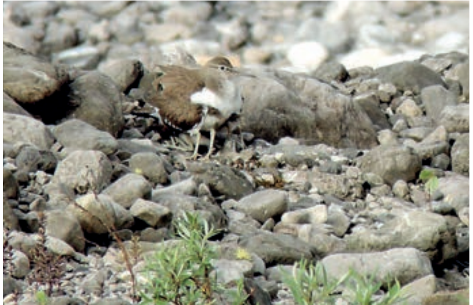
Den Naturpark-Rangern sind im Rahmen ihrer Arbeit außergewöhnliche Bilder des seltenen Flussuferläufers gelungen.