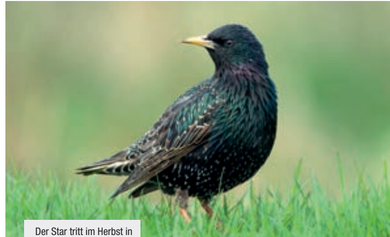
Der Star tritt im Herbst in riesigen Schwärmen auf.

Informationen zu Abflugzeit, Zugrichtung und Zugentfernung sind bei den meisten Vogelarten genetisch vorgegeben. Selbst in Käfigen gehaltene Zugvögel weisen zur Zugzeit eine sogenannte Zugunruhe