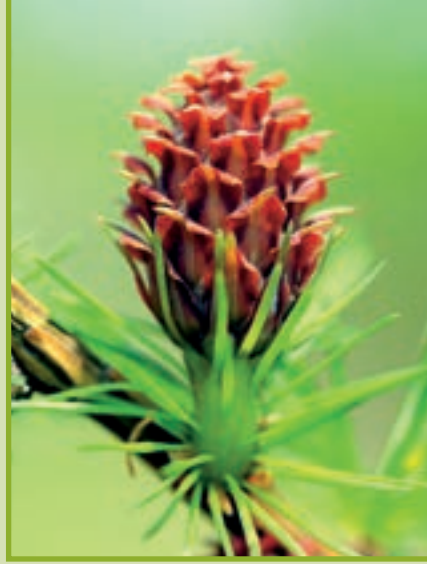
Die weiblichen Blütenstände stehen aufrecht an den Zweigen.