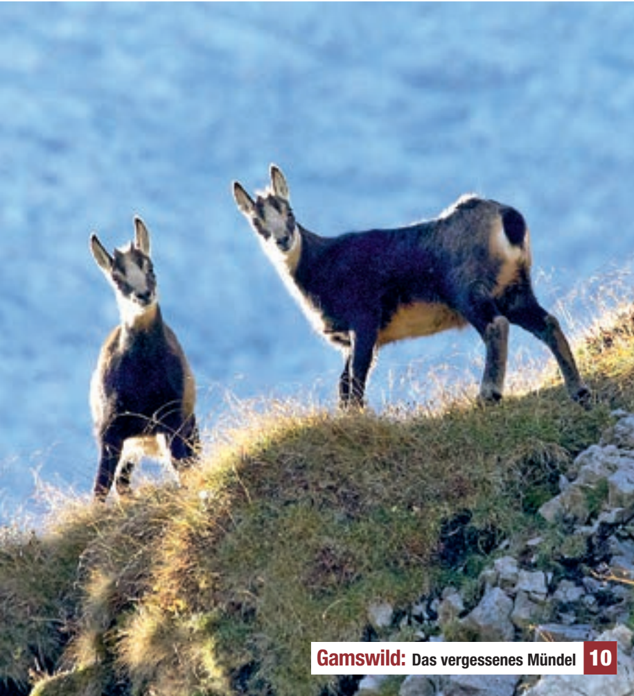
Gamswild: Das vergessene Mündel 10