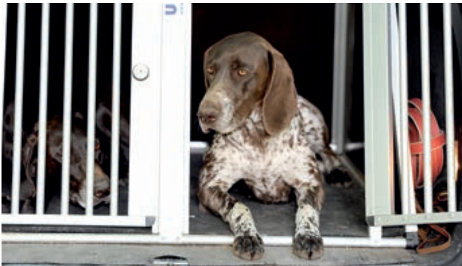
Nachdem die Hunde entspannt im Auto liegen geblieben sind und gewartet haben, dürfen sie zur Belohnung aussteigen.