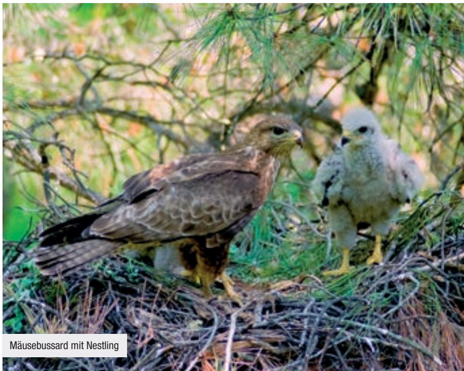
Mäusebussard mit Nestling

Die Eiablage erfolgt dann von Ende März bis Mitte April, wobei zwei bis vier, gelegentlich sogar fünf Eier in einem Abstand von zwei bis drei Tagen gelegt werden. Die Menge der gelegten Eier hängt vor allem von der zur Verfügung stehenden Futtermenge ab. Das Weib brütet weitgehend alleine und wird nur gelegentlich vom Terzel abgelöst. Auch beim Mäusebussard wird die Brutzeit zur Mauser genutzt.