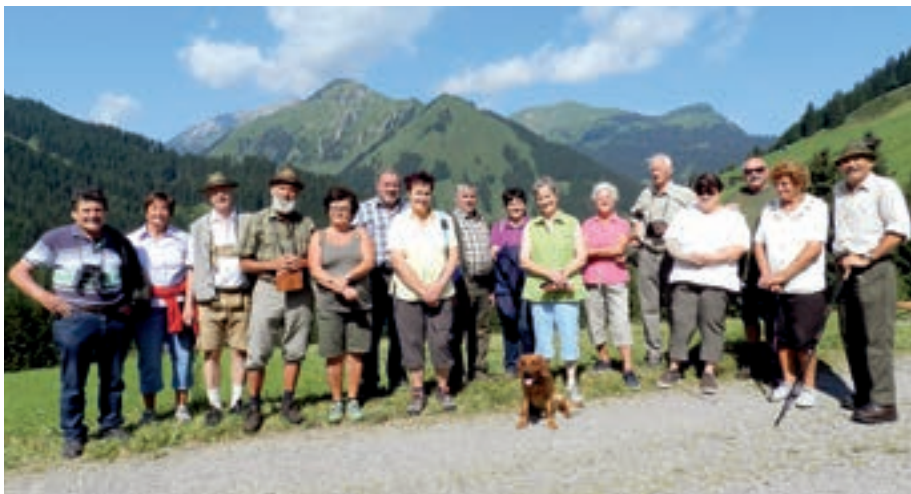
Die Pensionisten der Außerferner Berufsjägervereinigung trafen sich zu einer kleinen Wanderung in Berwang.