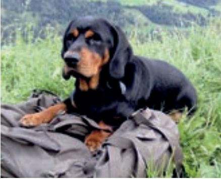
Wolf vom Omesberg