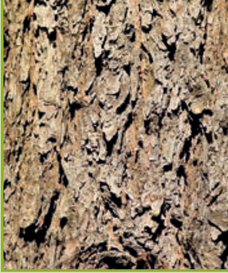
Die gräuliche, schuppige Borke alter Lärchen weist tiefe Furchen auf.