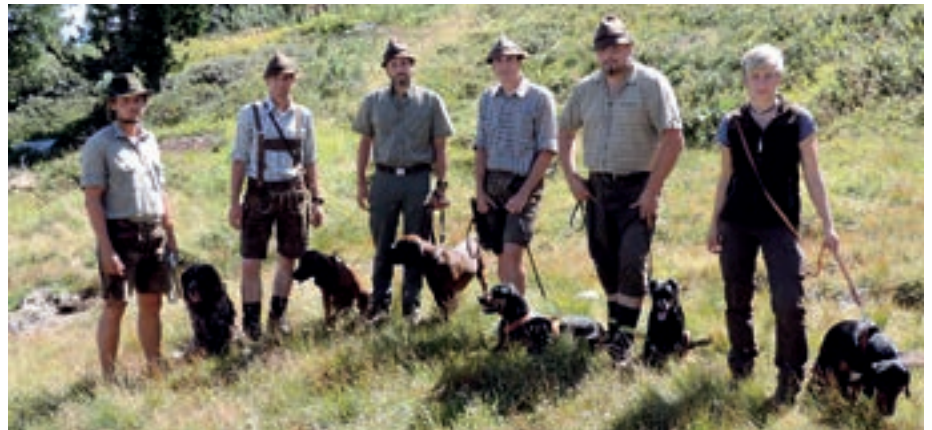
Erleichterung und Kameradschaft nach schwieriger Schweißarbeit.