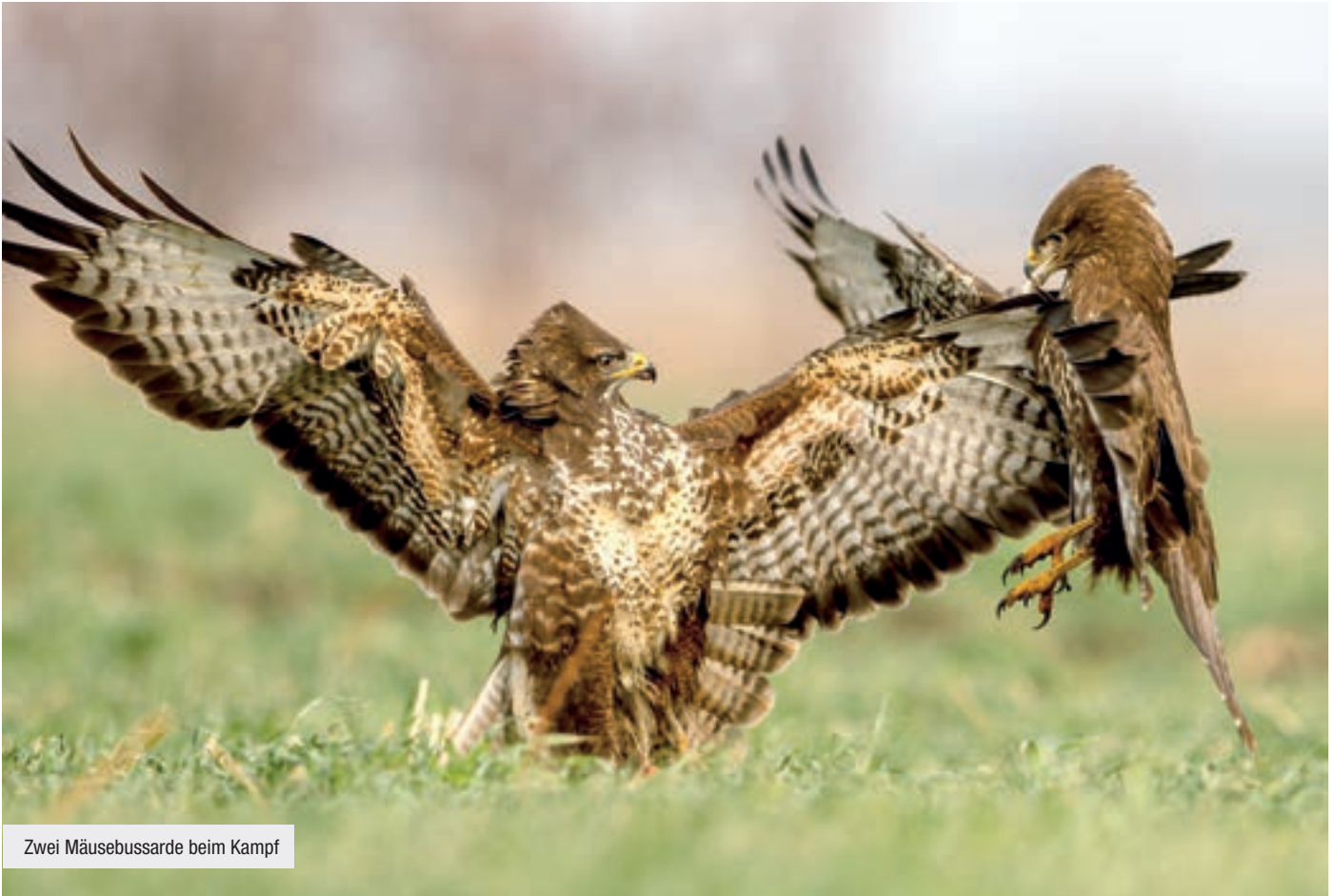
Zwei Mäusebussarde beim Kampf