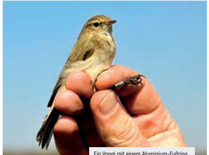
Ein Vogel mit einem Aluminium-Fußring.

Egal ob kurz oder lang, das Ziehen ist für Vögel anstrengend und gefährlich. Da die Brut-, Rast- und Überwinterungsgebiete oft Tausende Kilometer auseinander liegen, überfliegen die Tiere auf ihrem Weg oft mehrere Ländergrenzen. Neben natürlichen Hindernissen wie Wüsten und Meeren treffen sie dabei auch auf menschengemachte Gefahren. Die Reise vieler Großvögel endet daher oft schon an Stromleitungen und schlecht isolierten Strommasten. Auch der Zustand der Rast- und Überwinterungsgebiete ist für die Zugvögel lebenswichtig. Wenn wichtige Rastgebiete zerstört werden oder sich Überwinterungsgebiete wegen einer Dürre oder starker menschlicher Besiedlung verschlechtern, können die Bestände der Arten abnehmen, selbst wenn die Lebensräume im Brutgebiet noch intakt sind. Zudem werden die Vögel oft während dem Zug bejagt. Beispielsweise werden die erschöpften Vögel im Anflug auf ein Rastgebiet mit großen Netzen abgefangen und getötet. Jedoch ist der Vogelfang mit Vogelfallen jeglicher Art seit Inkrafttreten der EU-Vogelschutzrichtlinie im Jahre 1979 generell verboten. Die Richtlinie gibt in ihren Anhängen wieder, welche Vogelarten unter einem besonderen Schutzstatus stehen und welche bejagt werden dürfen. Den Bedürfnissen der Zugvögel kommt die Richtlinie im Speziellen nach. So fordert sie Schutzmaß-