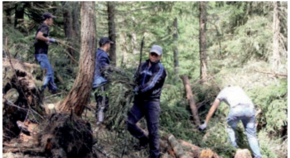
Durch den großen Einsatz der Asylwerber im heurigen Sommer konnten innerhalb kurzer Zeit weitere zwei Hektar auerwildfreundlich gestaltet werden.

Was an lebensraumverbessernden Maßnahmen in den letzten Jahren gesetzt wurde, muss vermutlich nicht im Detail erläutert werden. Bestände, vor allem Dickungen, wurden aufgelichtet (kleinere Komplexe aber