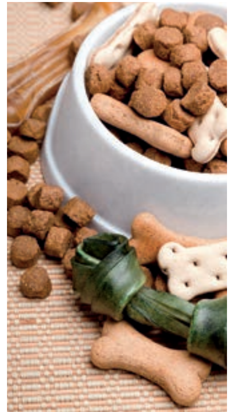
Es gibt heute ca. 100 verschiedene Sorten an Fertigfutter (Trocken- und Nassfutter) für Hunde.

➔ Wegen der großen Dehnbarkeit des Hundemagens können große Mengen pro Mahlzeit aufgenommen werden, womit eine einmal tägliche Fütterung reicht. Benötigt der Hund aufgrund einer starken körperlichen Belastung größere Futtermengen, so sollte diese auf zwei Rationen aufgeteilt werden.