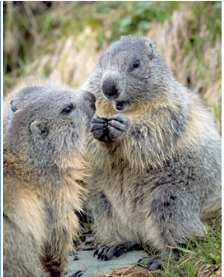
Hochwertige Nahrung mit einem hohen Anteil an ungesättigten Fettsäuren ist entscheidend für die Überwinterungstaktik von Murmeltieren.