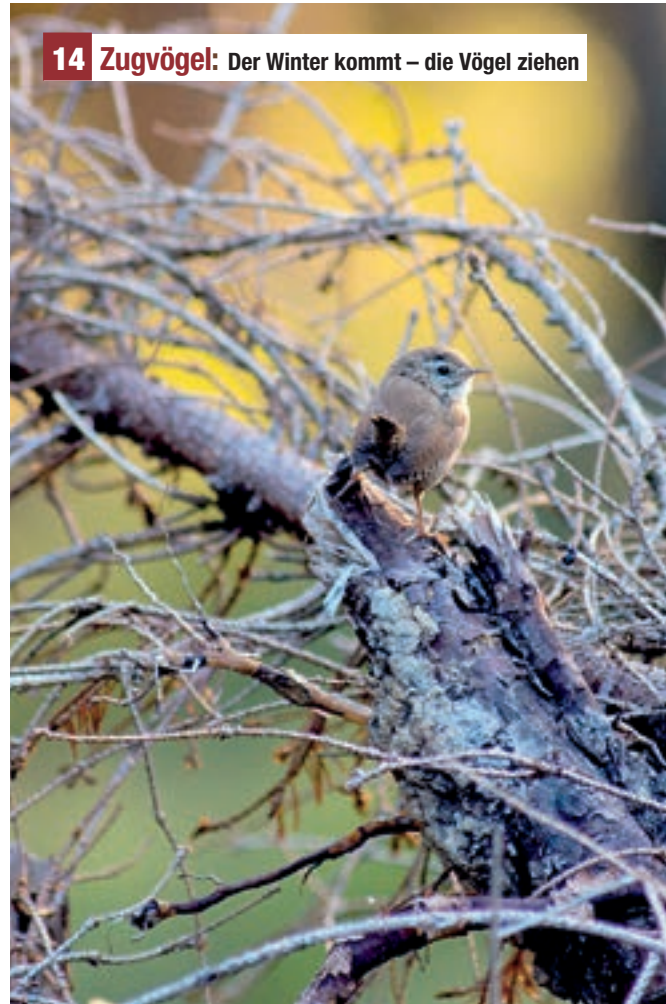
14 Zugvögel: Der Winter kommt – die Vögel ziehen